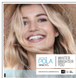
DALLE DE PLAFOND POLA Reorder M100293