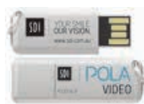
POLA SALLE D'ATTENTE USB VIDEO Reorder M100245