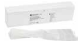
Boîtes de 1000 housses de protection à usage unique Radii Cal CX