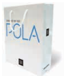
POLA SAC Reorder M100143