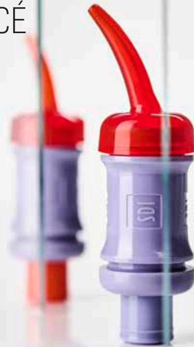
RIVA LIGHT CURE HV