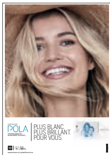
AFFICHE POLADAY Reorder M100317

Outils marketing pour la promotion de l'éclaircissement au cabinet