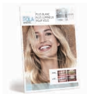
AFFICHAGE POLA AVANT ET APRÈS Reorder M100316