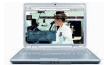
PLV PERSONNALISÉE Il est vous est possible de personnaliser votre PLV via téléchargement sur: www.sdi.com.au