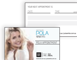
POLA CARTE DE RENDEZ-VOUS Reorder M100313