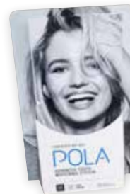
DISTRIBUTEUR POLA DE BROCHURES PATIENT Reorder M100290