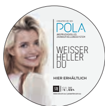
AUTOCOLLANT DE FENÊTRE POLA Reorder M100100