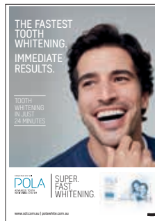
AFFICHE POLA RAPID Reorder M100579