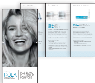
BROCHURES PATIENT POLA Reorder M100314