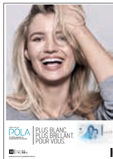
AFFICHE POLANIGHT Reorder M100318